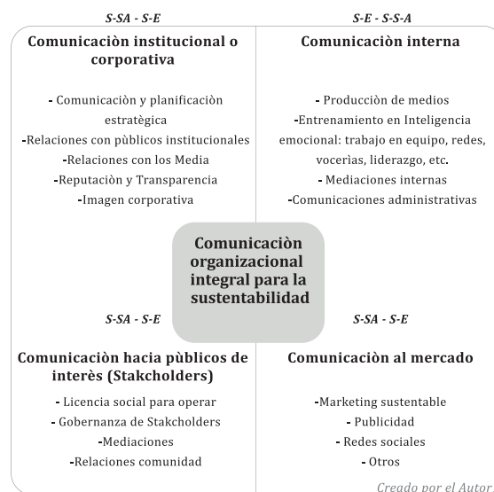
Figura 2: Modelo ampliado con funciones por áreas

En la figura 2 (ver abajo), en una apertura del modelo por funciones, distinguimos cuatro áreas diferenciadas: la Comunicación institucional o corporativa (del ámbito de la S-SA, aunque reiteramos que los 2 grandes dominios de la Comunicación Integral para la Sustentabilidad se interrelacionan e intersectan); la Comunicación hacia los públicos de interés acotada a la Gestión de Comunidades (S-SA); la comunicación interna (con foco en S-E); y la comunicación mercadológica (S-SA).